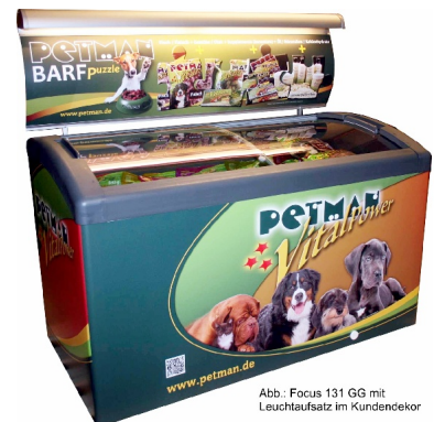
Abb.: Focus 131 GG mit Leuchtaufsatz im Kundendekor