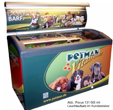
Abb.: Focus 131 GG mit Leuchtaufsatz im Kundendekor