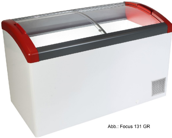
Abb.: Focus 131 GR

Eiscreme u. Verkaufstruhe Focus 151GR - Esta Artikelnummer: 11195